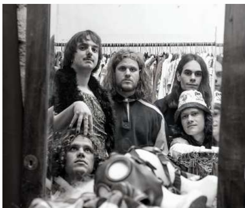
TH DA FREAK