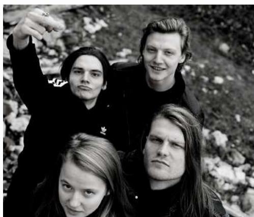
POGO CAR CRASH CONTROL